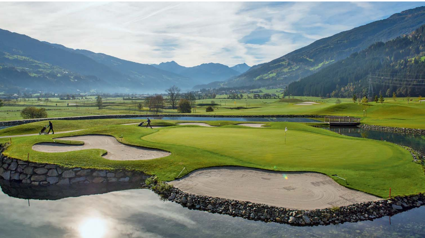
Ein fantastischer Platz ohne Schwächen: der GC Zillertal-Uderns