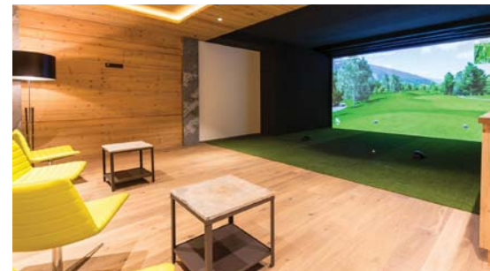
Die Sportresidenz Zillertal liegt direkt auf dem Golfplatz

Der Platz ist eine Augenweide und bietet Golfspaß auf internationalem Top-Niveau. Die Bahnen sind breit und so mutet der Platz wie ein waschechter Championship-Course an. Die riesigen Grüns sind recht tricky – im Grunde hat der Platz kaum Schwächen. Bahn 9 ist nicht nur das schwerste Loch auf dem Platz, es ist auch das schönste: Das Par 4 führt über knapp 400 Meter erst nach oben, danach kippt die Bahn bergab auf das Clubhaus zu und endet auf einem wunderbaren Inselgrün. Hier sollte man sich anstrengen: Das Grün ist von der Clubhausterrasse und fast allen Zimmern perfekt einsehbar.