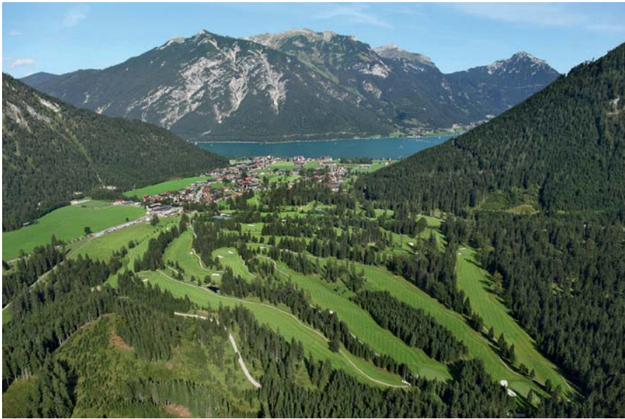
Der GC Achensee gilt als einer der schönsten Plätze Österreichs