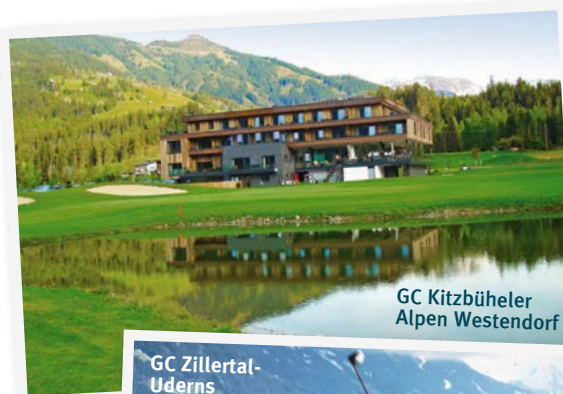
GC Kitzbüheler Alpen Westendorf